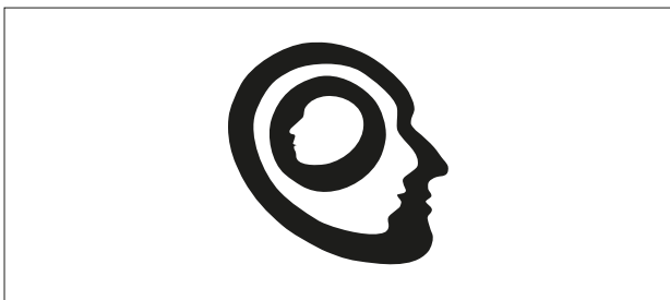
Obr. 1 Logo

na gerontopsychiatrickú sekciu. O vzniku súдно-psychiatrickej sekcie uvažoval výbor spoločnosti už v roku 1975, založená bola o dva roky neskôr. Sekcia pre alkoholizmus a iné toxikománie a psychofarmakologická sekcia vznikli v roku 1978, o rok neskôr komisia pre mentálnu retardáciu a pedopsychiatrická sekcia , po čase premenovaná na sekciiu detskej a dorastovej psychiatrie . Postupne sa konštituovali aj ďalšie sekcie: v roku 1982 psychotherapeutická sekcia a v roku 1984 komisia sociálnej psychiatrie . 13 Slovenská psychiatrická spoločnosť SLS pri svojom osamostatnení v roku 1993 mala 7 sekcií.